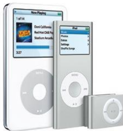
Figura 1: alinhamento actual do iPod.

Os modelos existentes variam em tamanho, e as suas funcionalidades e capacidades aumentam em função do tamanho do dispositivo. O alinhamento actual consiste no iPod de 5ª geração com capacidade de reproduzir vídeo, o pequeno iPod nano e o iPod sem ecrã, iPod shuffle (figura 1).